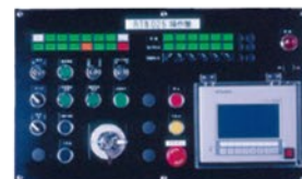
新開発の操作盤 Newly developed operational panel

The NC Transfer RTN Series is a multi-stage auto-transfer component boasting excellent freedom of movement, easy attachment and superior operability. This series changed the common perception of multi-stage transfer systems with a level of refinement that clearly reflected the needs of the workplace down to the last detail, starting with the user-friendly programming facilitated by the flexible pattern settings for five-axis control and ORII & MEC's specialized controller.